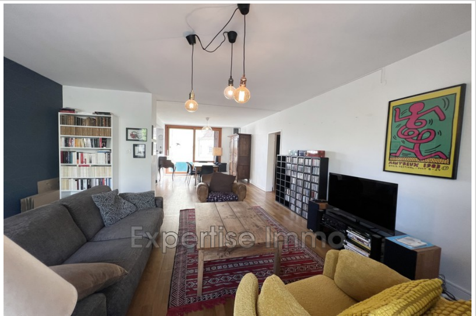
Appartement 424 Colmar